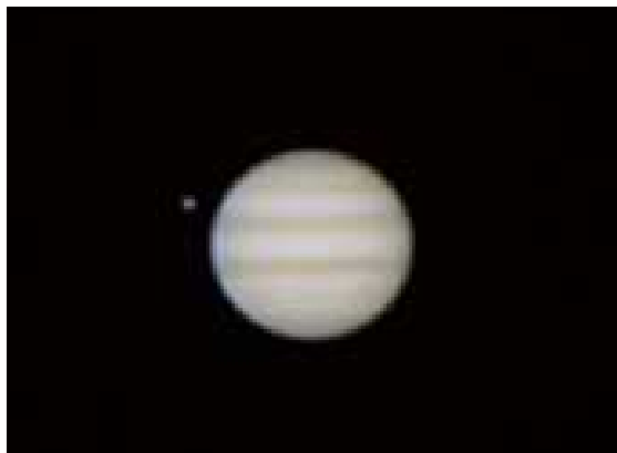
図 3-4 木星の様子