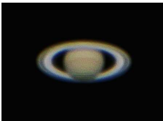
図 3-3 土星の様子

環があることで有名な惑星です。双眼鏡で環を確認することは難しいですが、望遠鏡で観ると土星本体にうっすらと縞模様があることや環の様子（隙間があり、いくつかの環からできているなど）、周りにあるいくつかの衛星を見ることができます。見どころが満載ですので、木星と同じくおすすめの天体です。しっかりと細かいところまで探検するとたくさんの発見があると思います。