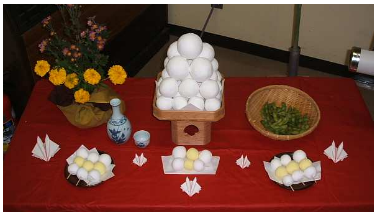
図 4-4 お月見の飾り

お月見の時期は夏の暑さも和らぎ、空気も澄んでいるため、月の観望には最も良い時期とされていました。昔からお月見の夜には祭壇を作り薄（すすき）などを飾って月見団子・里芋・枝豆・栗などを盛り、御酒を供えて月を眺めました。十三夜には旬の大豆や栗などを供えることから、“豆名月”または“栗名月”と呼ばれることもあります。十五夜と十三夜のどちらか片方の月見しかしないのは「片見月」と言って嫌われました。