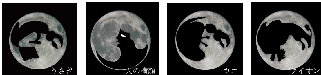
図 4-2 月面の模様の見え方の例

月をよく見ると、白っぽい石でできた部分と黒っぽい石でできた部分があることに気がきます。日本では昔から黒い部分の模様をうさぎの姿に例えてきました。ところが、この模様がどんな形に見えるかは国や地域によって違います。図 4-2 の例以外にもまだまだたくさんあります。みなさんは、何の形に見えますか？