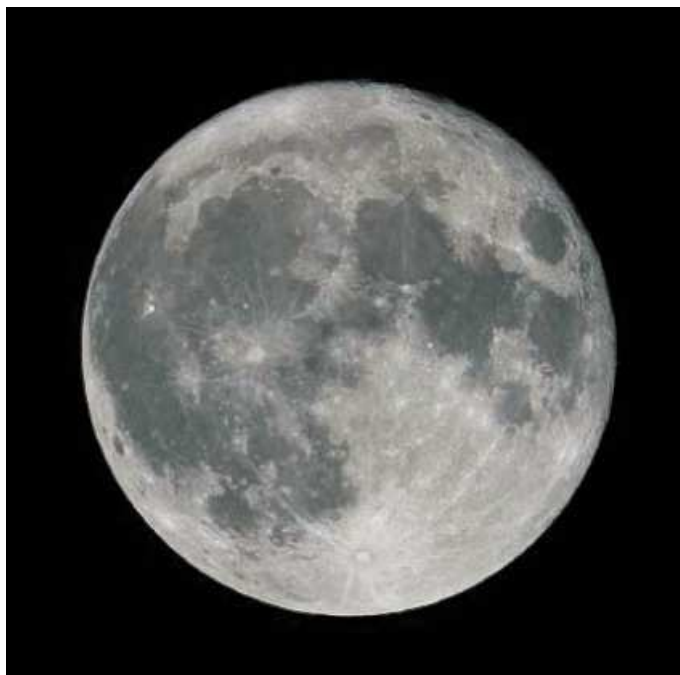
図 4-1 満月に近い月

“月 (Moon)” は地球の周りを回っている天体で、地球にとってはただ1つの“衛星 (satellite)” です。月という名前の由来には諸説ありますが、太陽の「次ぎ」に明るいということから付いたものだと言われています。月は自ら輝いている訳ではなく、太陽の光を反射して輝いています。実際は球形をしています。太陽の光の当たっている部分をどの方向から見るかによって、月の形が変わっているように見えます。この見かけの形は約30日の周期で変わっていきます。ちなみに、この周期を基に人間は1ヶ月という単位を作りました。月は人類が地球以外で降り立ったことのある唯一の天体です。