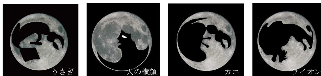
図 4-2 月面の模様の見え方の例

月をよく見ると、白っぽい石でできた部分と黒っぽい石でできた部分があることに気がきます。日本では昔から黒い部分の模様をうさぎの姿に例えてきました。ところが、この模様がどんな形に見えるかは国や地域によって違います。図 4-2 の例以外にもまだまだたくさんあります。みなさんは、何の形に見えますか？